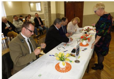
Zadania wykonywali też jury.