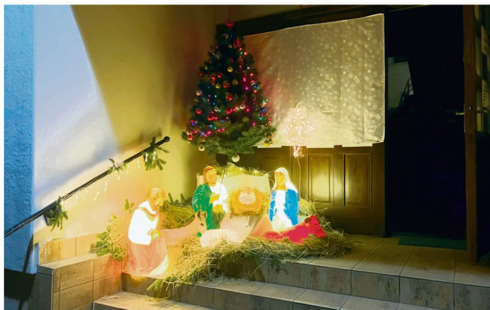
Stawy Grojeckie.