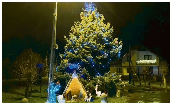
Stawy Monowskie.