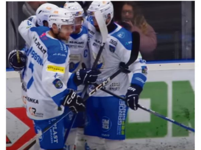
Kibice biało-niebieskich niezłomnie wierzą, że drużyna spełni ich marzenia i wzniesie jeszcze w tym roku puchar za zdobycie mistrzostwa Polski.