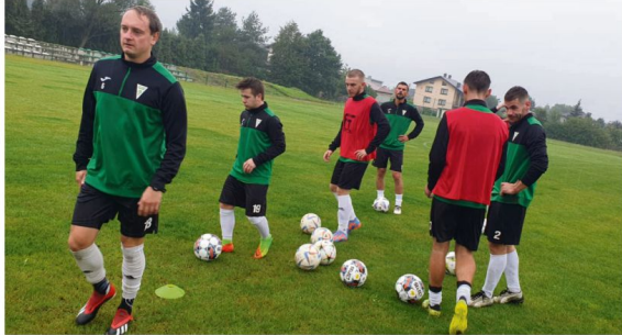
Iskra Brzezinka rozegra sześć sparingów w okresie przygotowań do rundy wiosennej.

Pierwszy sparing z udziałem Iskry odbędzie się na stadionie Lachów w Lachowicach. To przedstawiciel wadowickiej klasy A grupy pierwszej, który na półmetku rozgrywek zajmuje szóste miejsce. Tydzień później na stadionie Skawy w Wadowicach drużyna z ulicy Sportowej zmierzy się z Olimpią Chocznia (V miejsce w lidze okręgowej).