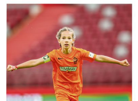
Do końca stycznia trwają zapisy do XXIV edycji Pucharu Tymbarku.

Zespoły dziewcząt i chłopców rywalizują w oddzielnych kategoriach, jednak istnieje również możliwość stworzenia drużyn mieszanych. Co więcej, w zespołach w kategorii U-10 i U-12 może wystąpić dwóch zawodników z młodszych roczników. Drużyny w kategorii U-8 powinny liczyć od minimum 5 do maksimum 10 zawodników, natomiast w kategoriach U-10 i U-12 – od minimum 6 do ma-